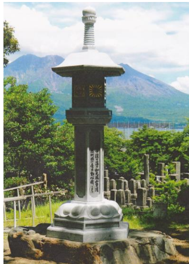
南洲墓地に建立された『西南之役官軍薩軍恩讐を越えて』の供養塔 (平成29年9月23日に除幕)