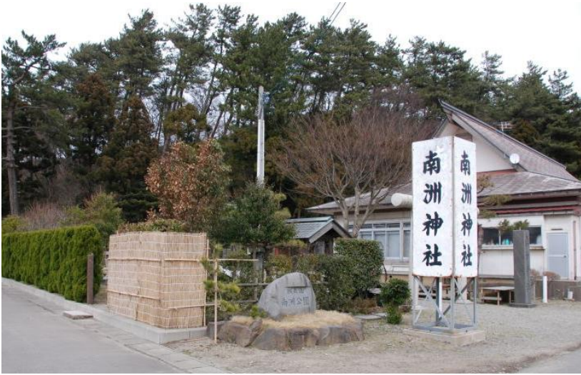
(財) 荘内南洲会によって昭和 51 年 (1976 年) に創建された南洲神社。酒田市飯盛山下にあります。上下写真とも、2010 年 3 月撮影。