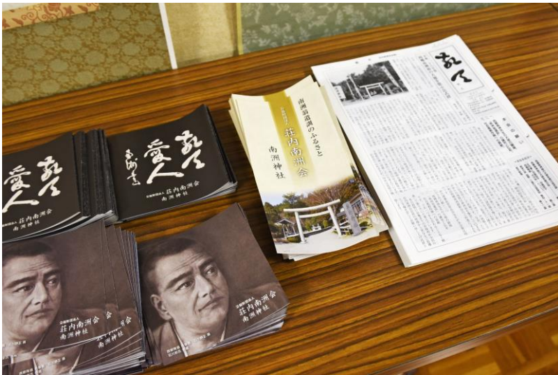
荘内南洲神社のパムフレット、年4回発行の機関誌『敬天』 2017年6月 荘内南洲神社で撮影。