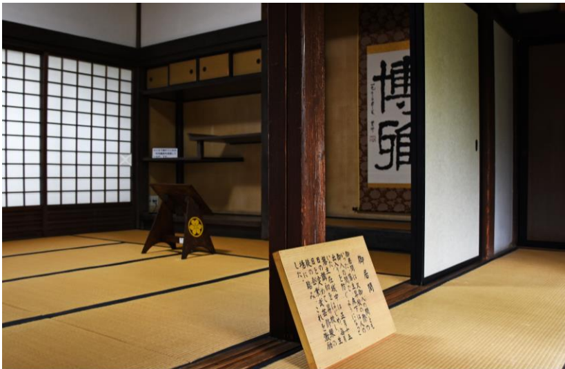
御居間（致道館） 藩主が昇校の際に御入りになった部屋。戊辰戦争で降伏した庄内藩が官軍参謀黒田清隆を迎えて謝罪したゆかりの部屋です。