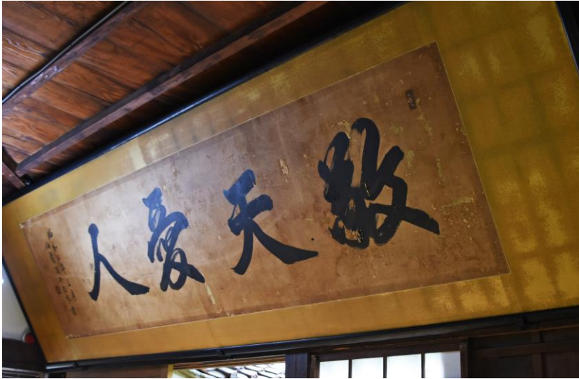
致道館（山形県鶴岡市）の扁額『敬天愛人』（昭和 2 年 3 月、旧庄内藩主酒井家 16 代・酒井忠良書）