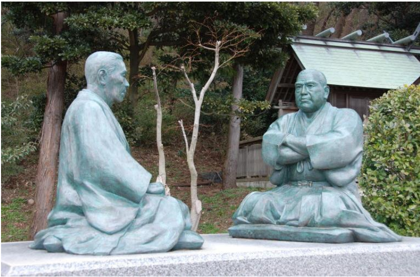
南洲翁と菅臥牛翁が対話している『徳の交わり』像。鹿児島市武町の西郷屋敷跡にあるものと同じものが平成 13 年 (2000 年) に建立されました。