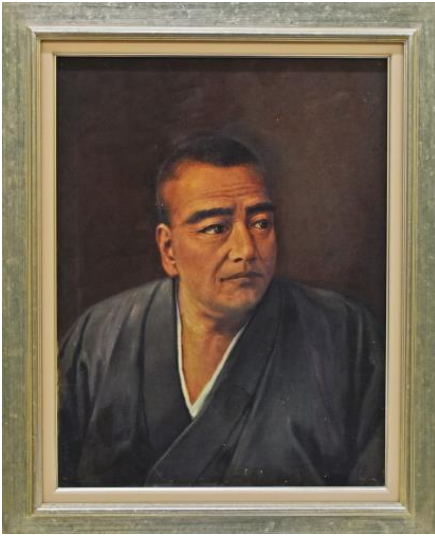
2017年6月 荘内南洲神社で撮影