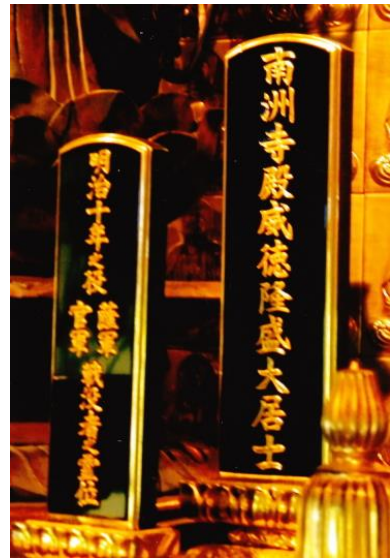
南洲翁位牌 製作者：高山学（八女市）

そもそも、浄光明寺は弘安四年（二二八四年）創建され、開山は第三世宣阿上人にて、島津初代忠久、二代忠時、三代久経、四代忠宗、五代貞久、二十一代吉貴公の菩提寺で、