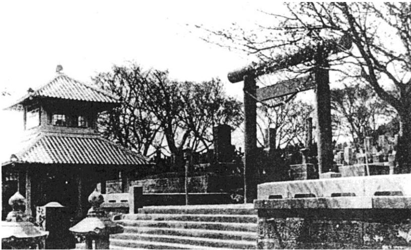
浄光明寺（南洲墓地）に建立されていた南洲堂。大東亜戦争末期の鹿児島大空襲で焼失した。上野の西郷像の原型で高村光雲作の木像が安置されていた。明治32年2月22日建立・昭和20年7月31日焼失。