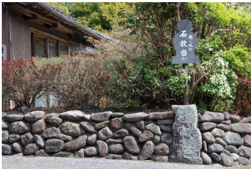
庵ノ坂の石敢当 (伝統的建造物群保存地区・入来麓)