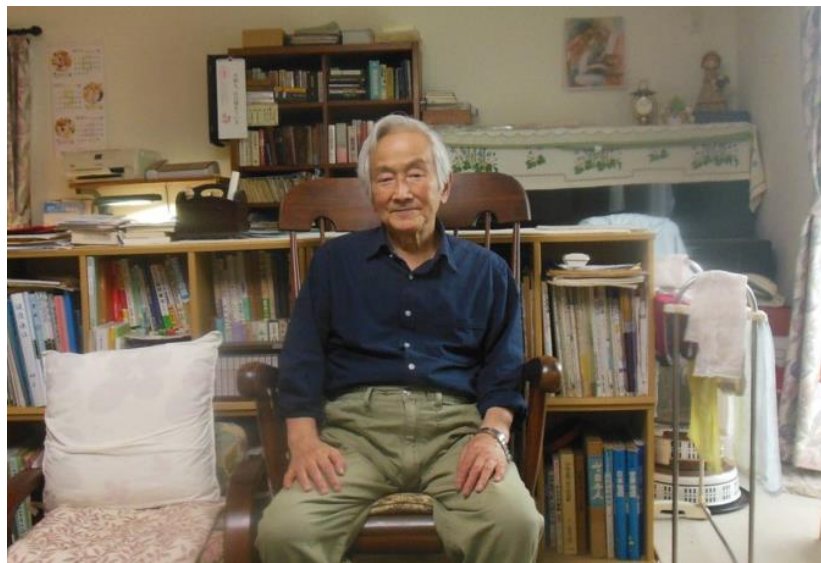
茨城県鹿嶋市の自宅にて著者