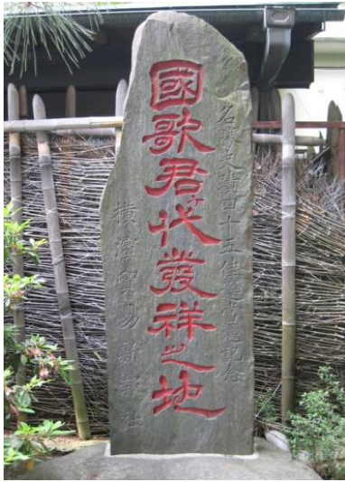
『国歌君が代発祥之地』の石碑 (横浜市・妙香寺) ①

頼します。フエン-tonはさっそく曲をつけ、1870年(明治3年)に薩摩バンドによって初演されたのです。すなわち、横浜の妙香寺の石碑は、国歌・『君が代』初演の地の石碑なのです。