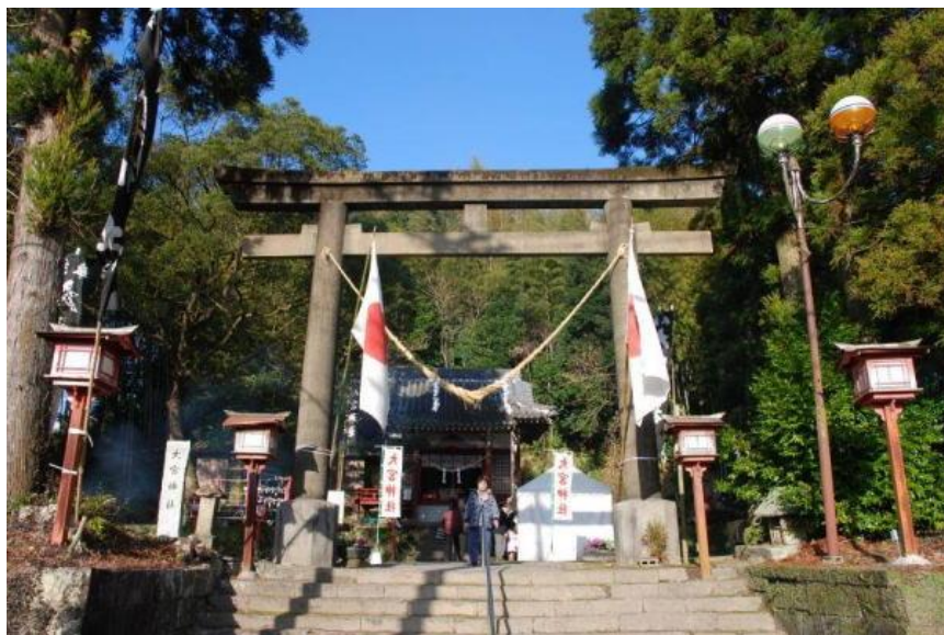
大宮神社 (2013年1月1日撮影)