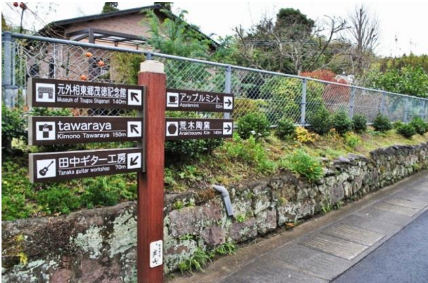
鹿児島県日置市美山地区の標識