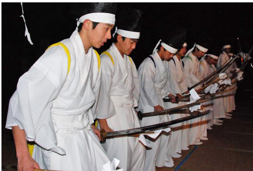
十二人剣舞 (大宮神社、2012年12月31日撮影)