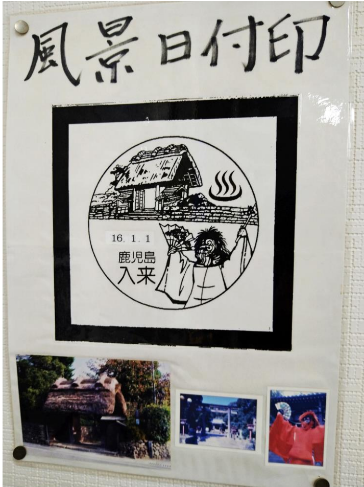
入来郵便局の風景日付印。大宮神社の神舞、武家屋敷群の茅葺門、温泉の町を象徴する温泉マークがデザインされています。