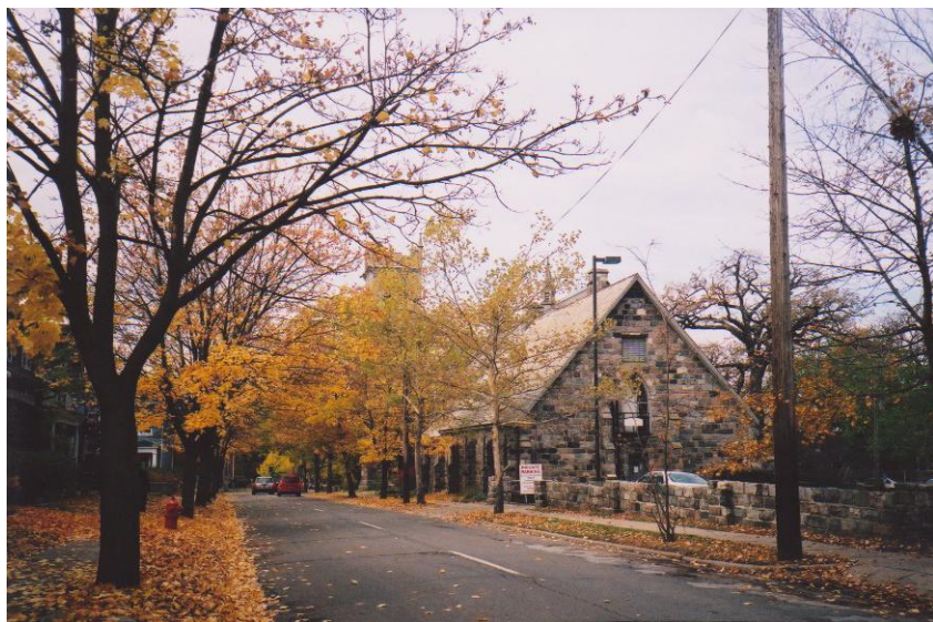
キリスト教会 (アンドリュー・エписコパル・チャーチ)