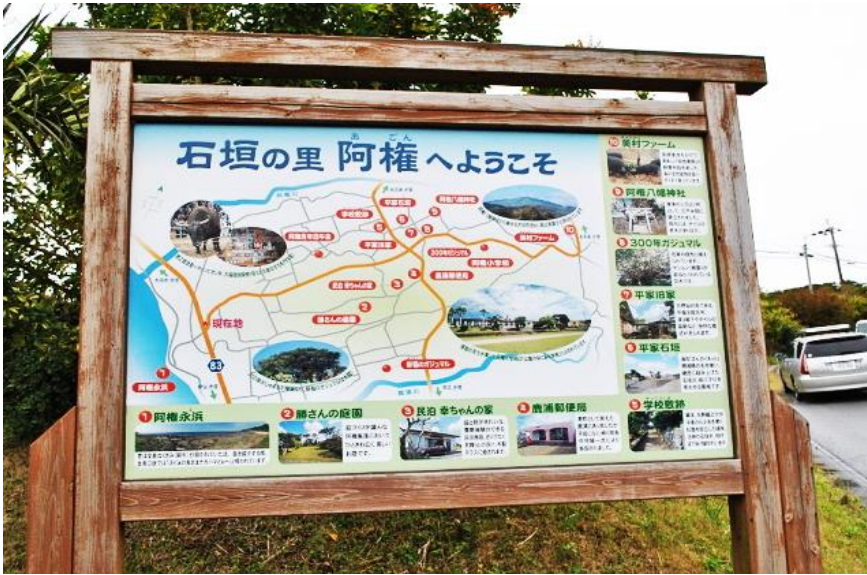
伊仙町（鹿児島県大島郡）石垣、阿権集落の看板