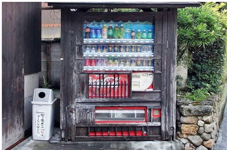
湯布院（大分県）の自動販売機