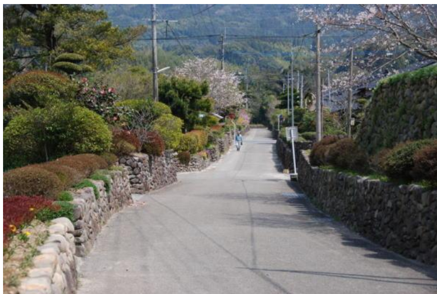
旧武家集住地の屋敷割り