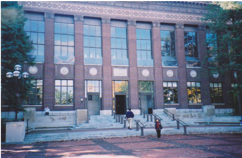
ミシガン大学大学院図書館の正面入口にて著者

テロの情報と日本の様子を知るために、毎日のようにバスで二十分の大学院図書館ハッチャーのアジアンライブラリに通い、日本コレクションコーナーで、一日遅れで届く日本の新聞に目を通した。恐らく数万点を蔵するであろう日本語関係の書籍は、日本の図書館と遜色ないほどの充実ぶりである。尚かつ、二十四時間オープンしていて、誰でも、行きずりの外国人であろうとホームレスであろうとフリーパスであった。当時の日本の大学図