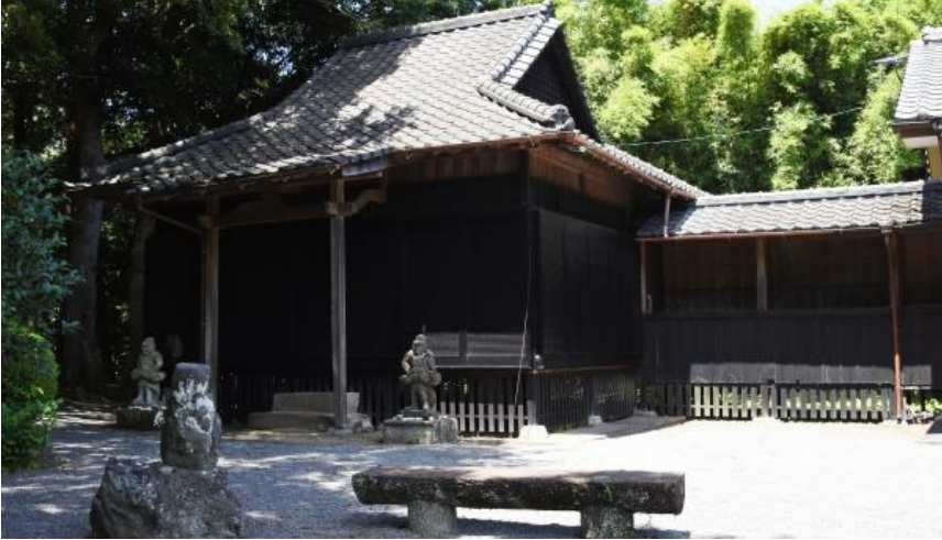
薩摩琵琶発祥の地・中島常楽院 (鹿児島県日置市吹上町) (写真上) と薩摩琵琶 (写真左) ②