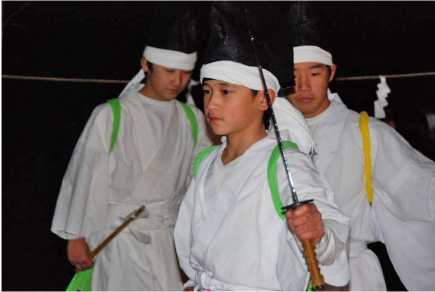
十二人剣舞（大宮神社、2012年12月31日撮影）