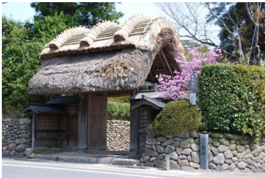
庶流入来院家の茅葺門