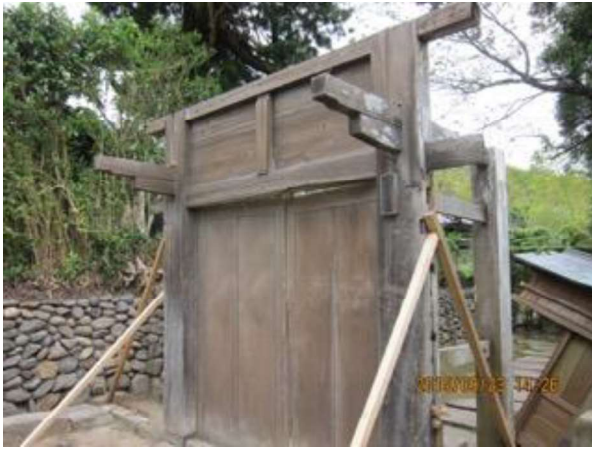
平成 27 年 8 月の台風 15 号で倒壊した茅葺門。平成 28 年 4 月、本誌表紙の写真に見るように新しく再現されました。

隣接地の牧野に全頭逃げ出して困った。1 年中の飼料の確保、分娩管理、子牛育成、搾乳など 1 年中絶え間なく働くため、年間を通じて必要かつ最低限の労力で接する必要がある。1 年間に亘って牛を飼育する技術は稲作と全